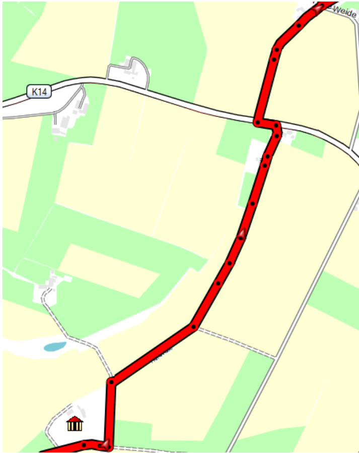
Kaart 5 1:300