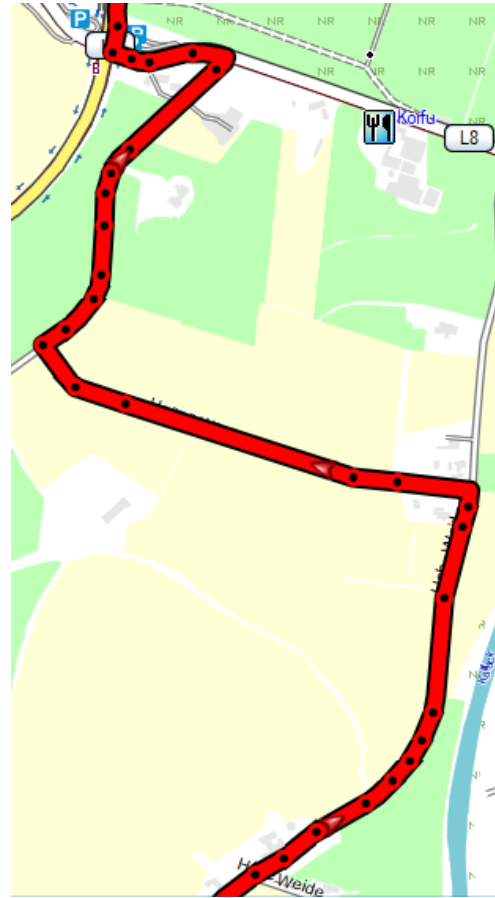
Kaart 6 1:300